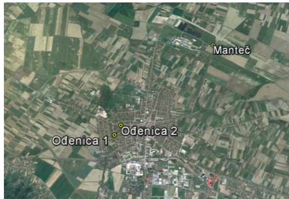
Slika 1. Karta područja istraživanja s označenim postajama Figure 1 Map of survey areas with designated stations

Izrađena je skica karte 50-metarskog dijela svake postaje koja uključuje sva važna obilježja oko i unutar vodenog staništa, napose, tip staništa na kojem će se vršiti uzimanje uzoraka makrobekralježnjaka (GLOBE, 2003). Prikazana su sva staništa na karti važna za razumijevanje i interpretaciju podataka